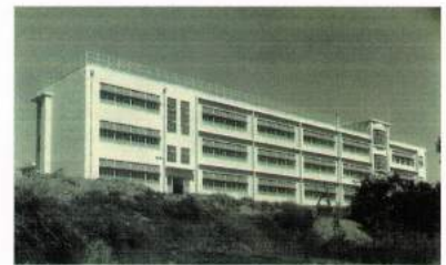
昭和32年 北校舎完成