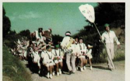
昭和40年代 川名小 秋祭り