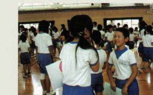
平成20年代 川名小・伊平小と交流・統合