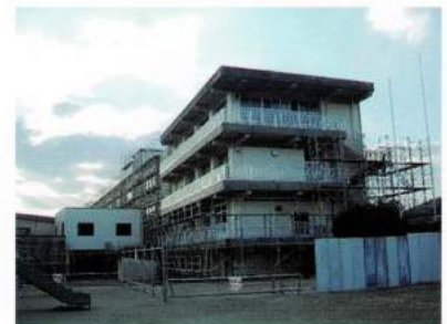
平成26年～北校舎改築工事