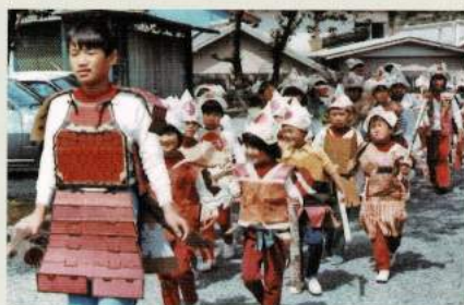
昭和50年代 伊平小 かぶと落とし合戦