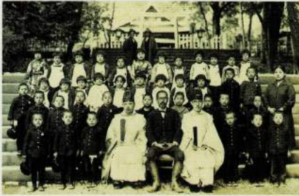
昭和初期 井伊谷宮 入学児童奉告祭