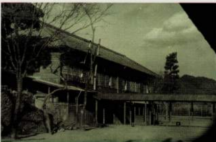
昭和30年ごろ 木造校舎