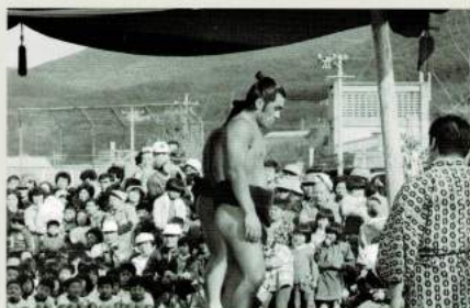
昭和50年代 土俵開き