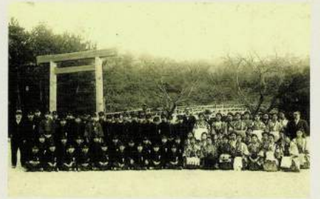
昭和初期 伊勢神宮 参宮旅行