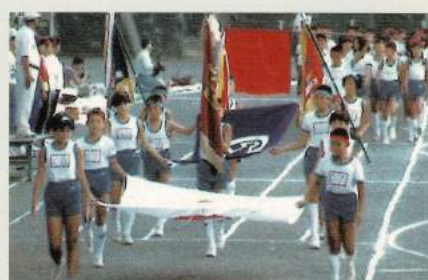
平成元年代 運動会