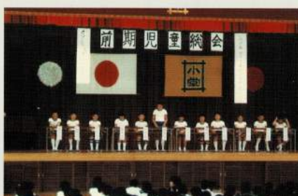
昭和60年代 児童総会