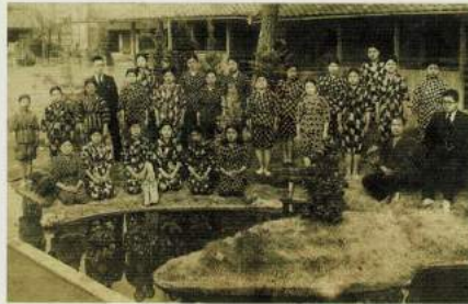
昭和初期 庭の築山