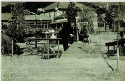
昭和30年代 旧北校舎建設