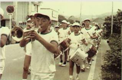
昭和40年代 鼓笛パレード