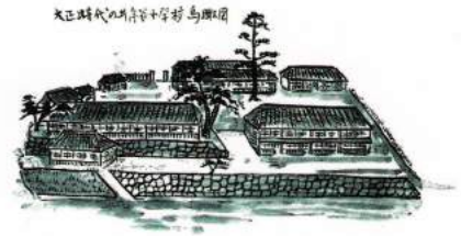
大正時代の井伊谷小鳥瞰図