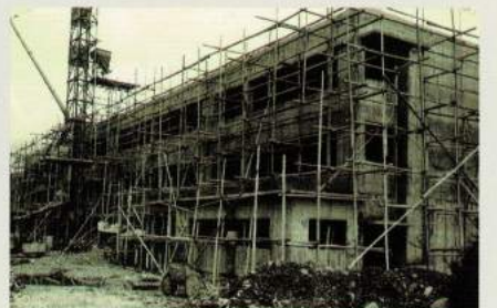
昭和30年代 旧北校舎建設