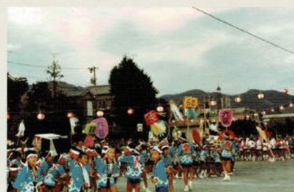
昭和50年代 井小まつり