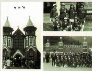
昭和40年代 修学旅行