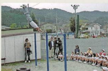
平成10年代 伊平小 スーパーじいちゃん