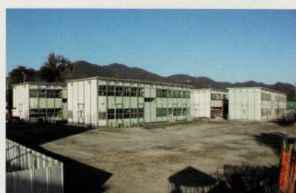
平成20年代 新校舎建設 仮設校舎